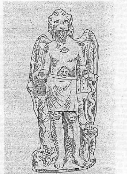
Σκίτσο από το ανάγλυφο του Μίθρα Χρόνου - Ζερβάν από το Castel Gandolfo (περιοχή κοντά στη Ρώμη) (φωτ. Κ. Μεγαλομμάτη).