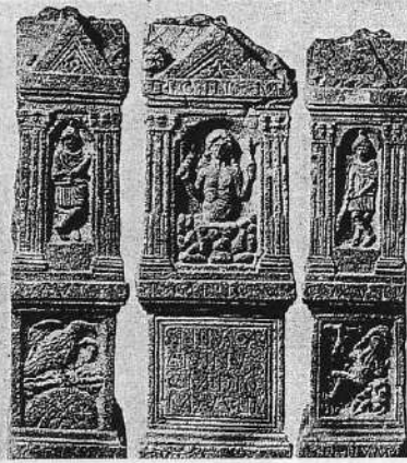
Ανάγλυφο του ηλιακού τριαδικού Μίθρα από το Medernheim . Αριστερά: καύτης (Ανατολή), κέντρο: Μίθρας (μεσημβρία), δεξιά: καυτοπάτης (Δύση).

σοντας το κοσμικό πυρ και τα φίδια ακουμπούν στα χέρια του, κάνοντας επτά πτυχώσεις, για να παραβάλλονται με αστρικά δεδομένα. Είναι προφανώς χωρίς φύλο, ως πρωταρχική μορφή και κλειδοκράτορας της Janua - τύλης Αθή. Ως προς το τελευταίο διαλαμβάνει δραστηριότητες του Ιανού. Ο Ζερβάν - Μίθρας - Κρόνος χρησιμοποίησε στον μιθραϊσμό ως χωνευτήρι δραστηριοτήτων άλλων προσώπων του κόσμου του θρησκευτικού συγκρητισμού: Α) της Αταργάτης της Ηλιούπολης της Συρίας, η οποία ήταν η τελευταία έκδοση του ασουροβαβυλωνιακού και φοινικικού Χαντάντ, Β) του Φάνη, αυτού του περιέργου Γάννη, ο οποίος όσο πιο αμφίβολη προσωπικότητα έχει, τόσο πιο συγκεκριμένα επαναφέρει στο προσκήνιο τον ασουροβαβυλωνιακό άνθρωπο - ιχθύ, θεό Έα, Γ) του Αιώνα, ο οποίος είχε συνδεθεί με τα ισιακά μυστήρια κρατώντας το Άνγκ, σημείο ζωής και Δ) του Σέρραπ, άλλου απόστολου του θανάτου. Άλλωστε τα τρία προσώπια λιονταριού είναι και αυτά σύμβολο τριαδικότητας, όπως και τα ανάλογα τρία κερβέρου, πράγμα το οποίο εύκολα είχε ερμηνευτεί από τον Μακρόβιο ως «χρονικός τριαδισμός».