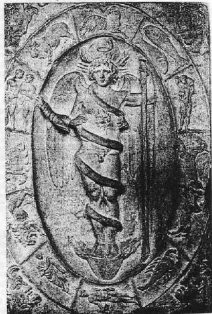
Ανάγλυφο του Μίθρα Χρόνου - Φάνη, περιβαλλόμενο από τον ελλειψοειδή ζωδιακό κύκλο (Μουσείο Μοδένας).

Για την τρομακτική πνευματική επιβολή επιτρατεύεται και ο Ζερβάν, περσικός θεός του Χρόνου, περιτυλιγμένος με τον όφι, στο ανάγλυφο του Μιθραίου Barberini ή με προσωπείο λιονταριού (στα γόνατα και στον ομφάλιο λώρο) και μονό οφθαλμό στο στήθος, στο άγαλμα του Castel Gandolfo , θερινής διαμονής του χριστιανικού πάπα, όπου το κεφάλι του Ζερβάν είναι λέοντος εμέσ-